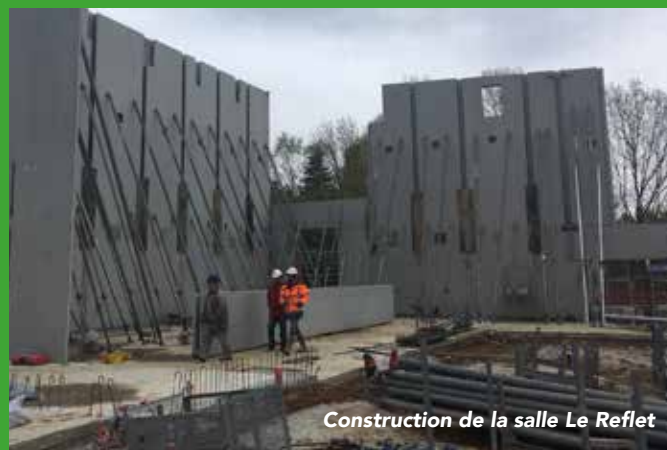
Construction de la salle Le Reflet