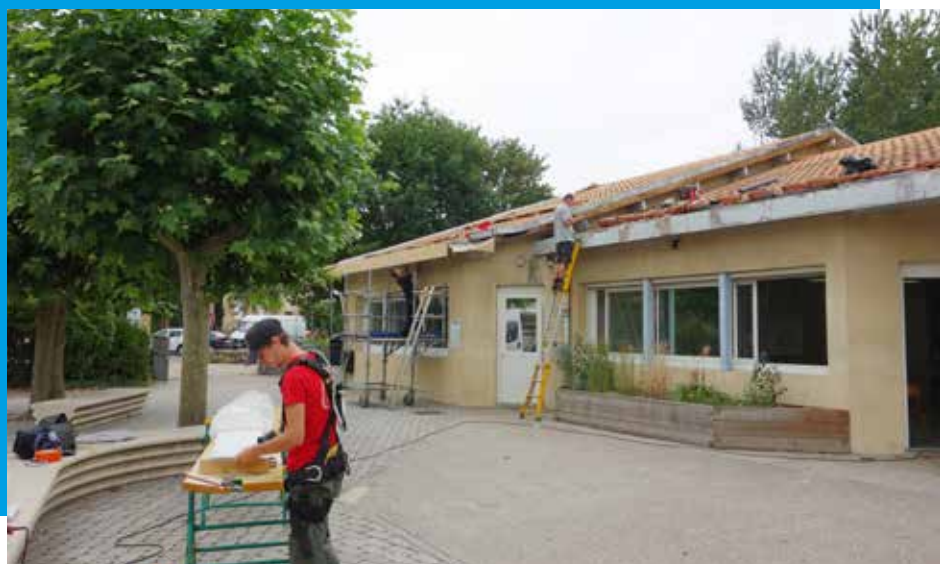
Travaux à l'école élémentaire

« L'éducation est l'arme la plus puissante qu'on puisse utiliser pour changer le monde » Nelson Mandela