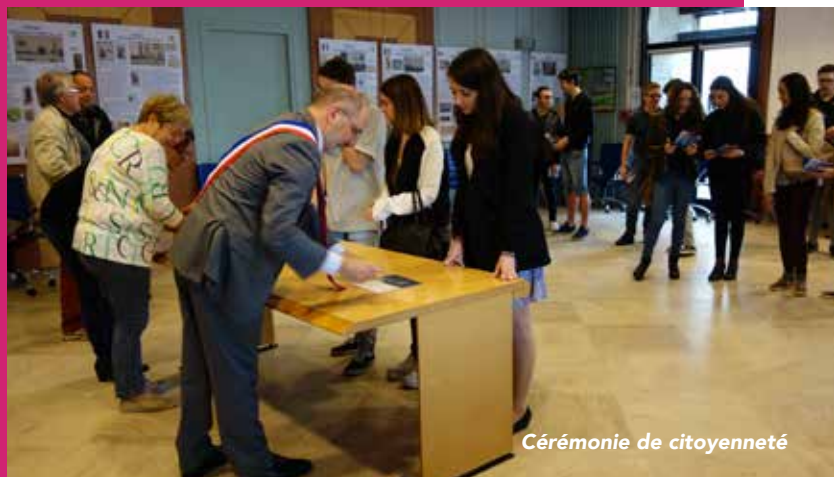
Cérémonie de citoyenneté