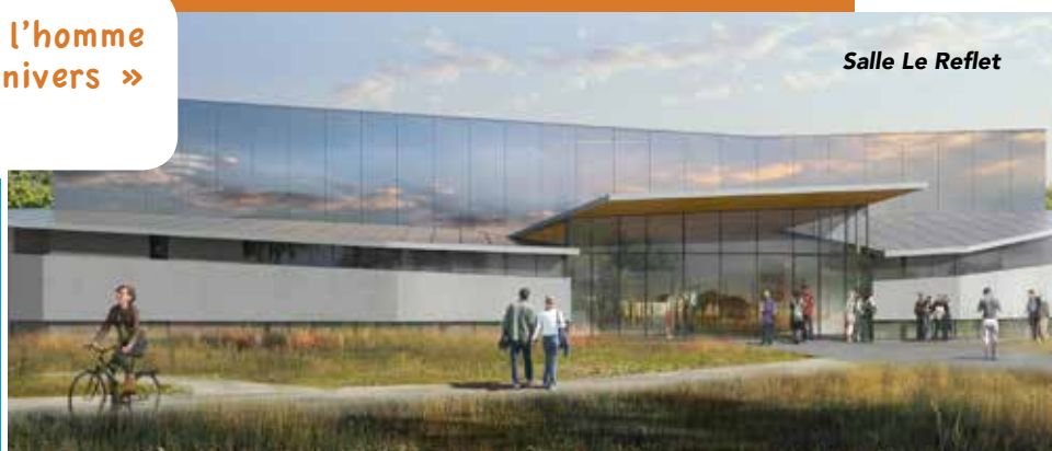
Salle Le Reflet

Tout cela ne pourrait fonctionner sans la richesse et la diversité des associations et l'engagement quotidien et continu des bénévoles.