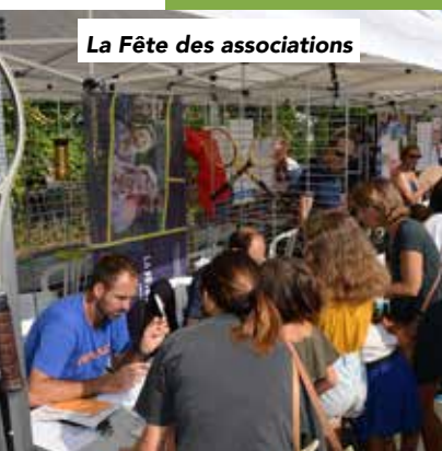
La Fête des associations

Chèque associatif offert à tous les enfants de moins de 18 ans pour favoriser la pratique des activités sportives, culturelles ou de loisirs ; la valeur du chèque a été portée à 20 euros ; plus de 350 enfants en ont bénéficié en 2019 ce qui représente plus de 7100 euros reversés aux associations sous forme de subvention.