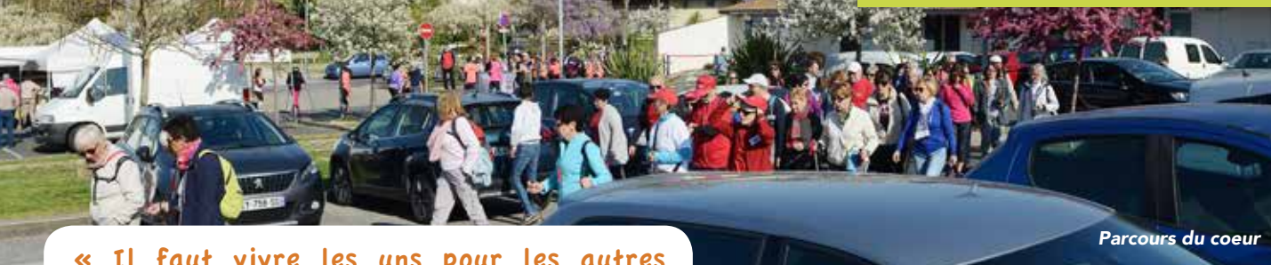
Parcours du cœur

« Il faut vivre les uns pour les autres et non pas les uns contre les autres »