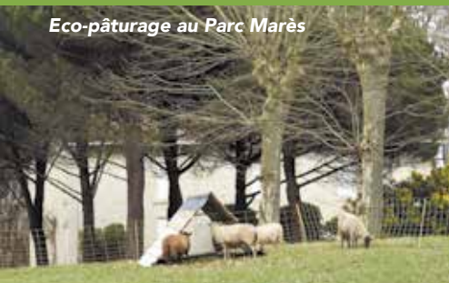
Eco-pâturage au Parc Marès