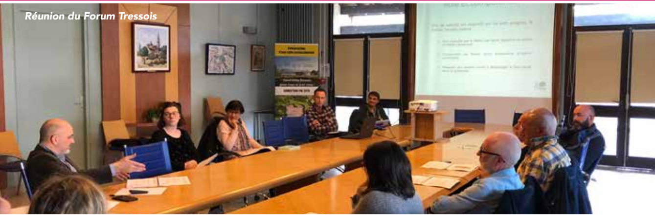
Réunion du Forum Tressois

Composé de 12 habitants tirés au sort puis volontaires, le Forum Tressois se réunit une fois par trimestre et est associé, selon l'intérêt manifesté par ses membres, aux groupes de travail sur les projets communaux.