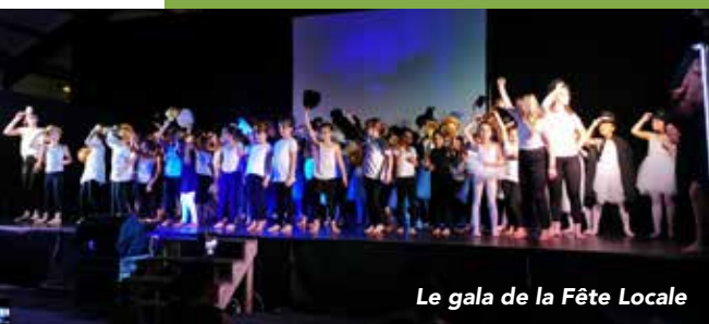
Le gala de la Fête Locale