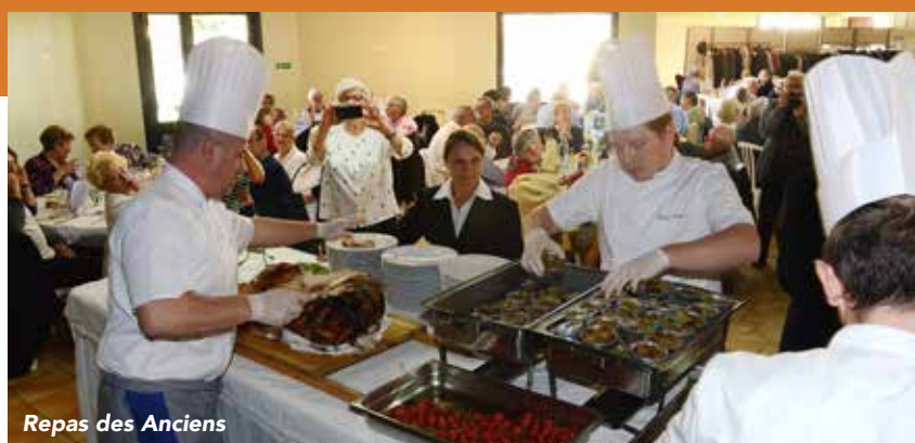
Repas des Anciens

* avec la Communauté de communes les Coteaux bordelais