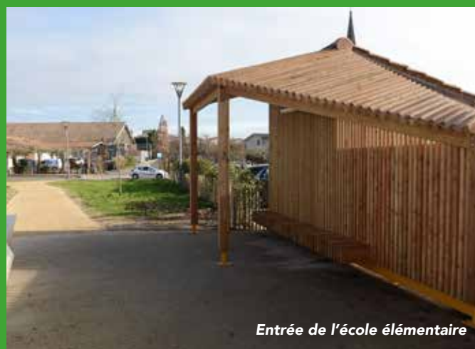
Entrée de l'école élémentaire

Tresses a obtenu la note de 19,7/20 au titre de la qualité des comptes de la commune par la Direction régionale des finances publiques.