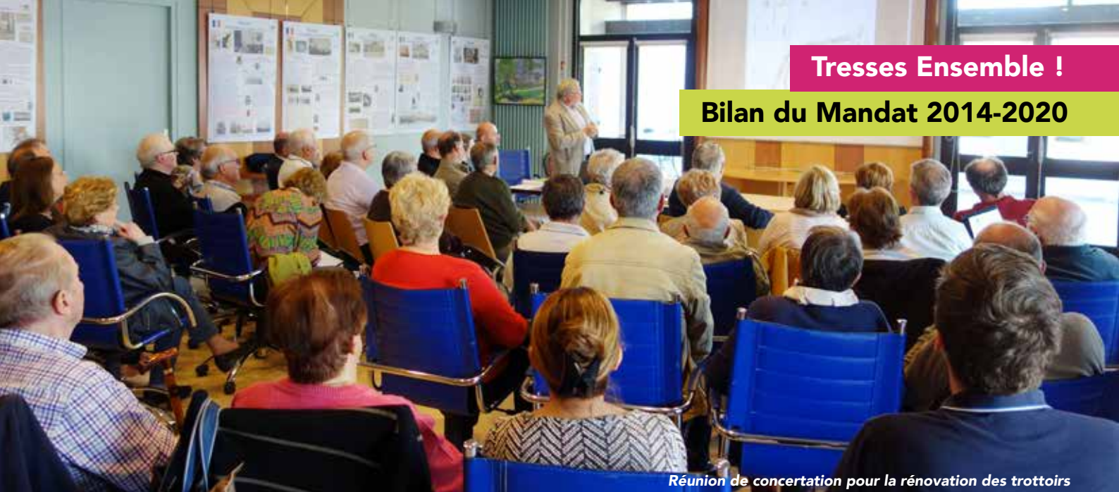
Réunion de concertation pour la rénovation des trottoirs