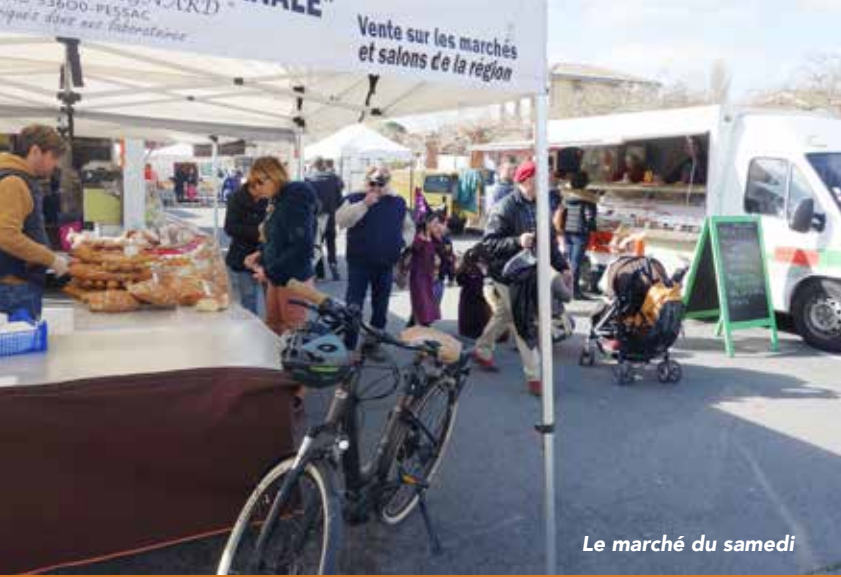
Le marché du samedi