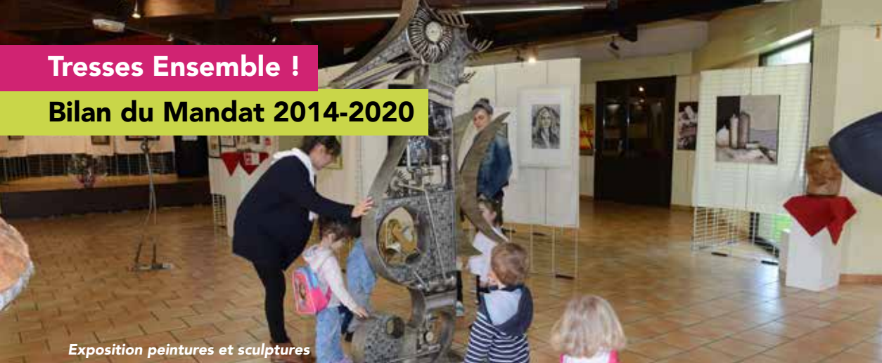
Exposition peintures et sculptures