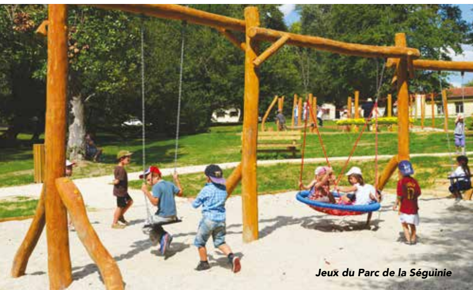
Jeux du Parc de la Séguinie