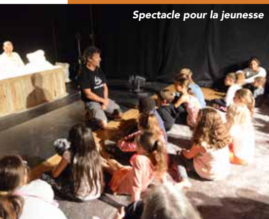
Spectacle pour la jeunesse