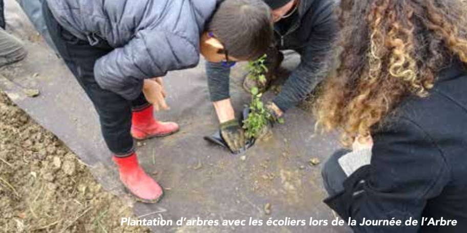
Plantation d'arbres avec les écoliers lors de la Journée de l'Arbre