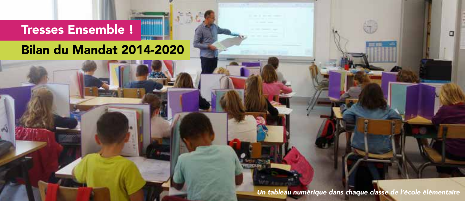
Un tableau numérique dans chaque classe de l'école élémentaire