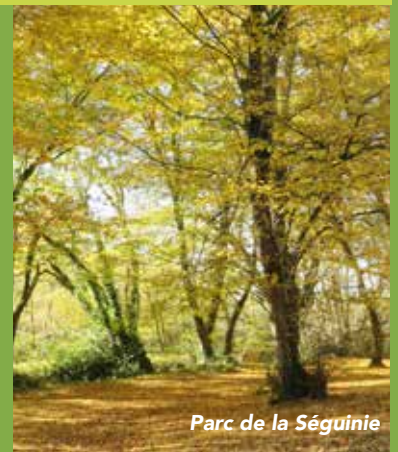
Parc de la Séguinie