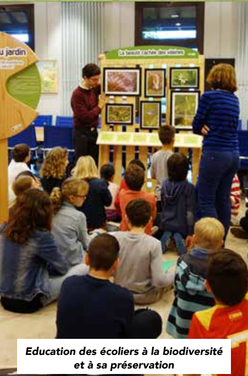
Education des écoliers à la biodiversité et à sa préservation